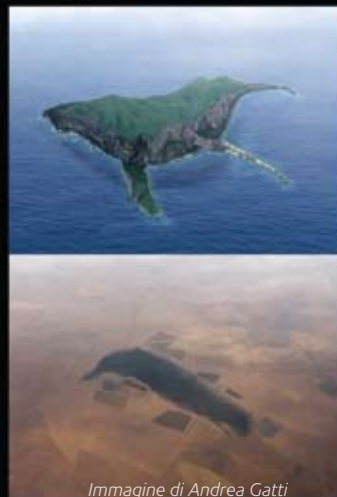
Immagine di Andrea Gatti