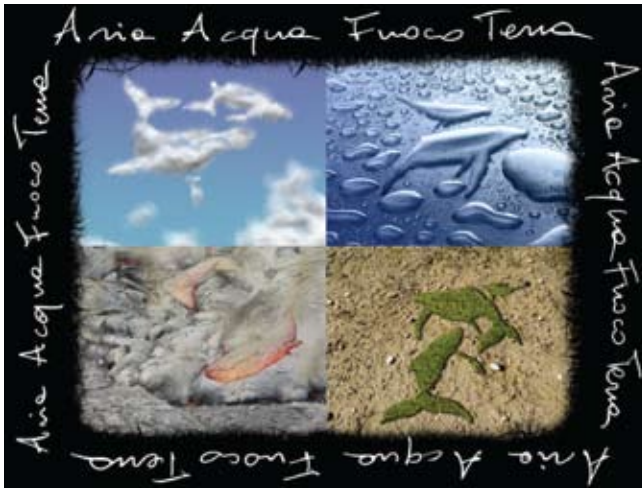
Immagine di Andrea Gatti

The blue whale can whistle up to 188 decibels, Humpback whales are also known as 'singing whales' and Killer whales move to a rythm. Seems to me that whales are a melody and add to the soundtrack that is this worlds orchestra. Listen to the song and sing along. Underneath each wave is a symphony. And silence would be the sound of death. Keep the oceans loud with it's volume turned to the fullest!